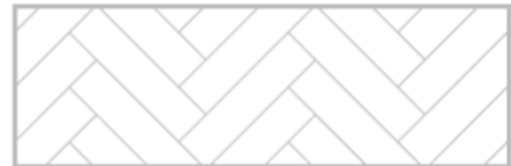
■ Verlegung Fischgrät